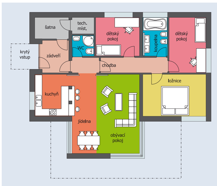
Půdorys rodinného domu PINE

V letošním roce představila firma Hoffmann nový katalog svých typových a pasivních