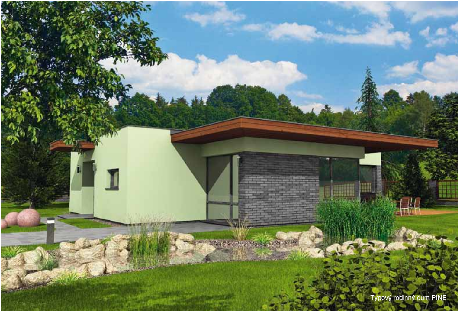
Typový rodinný dům PINE