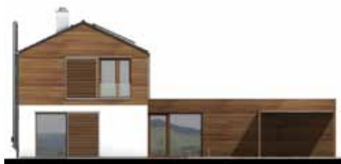
↑ RD HELIOS – technické pohledy