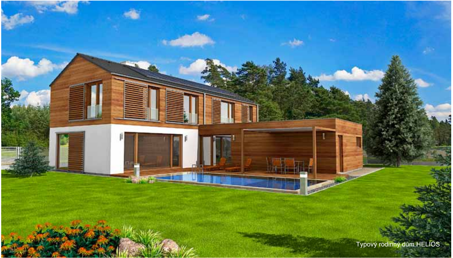
Typový rodinný dům HELIOS