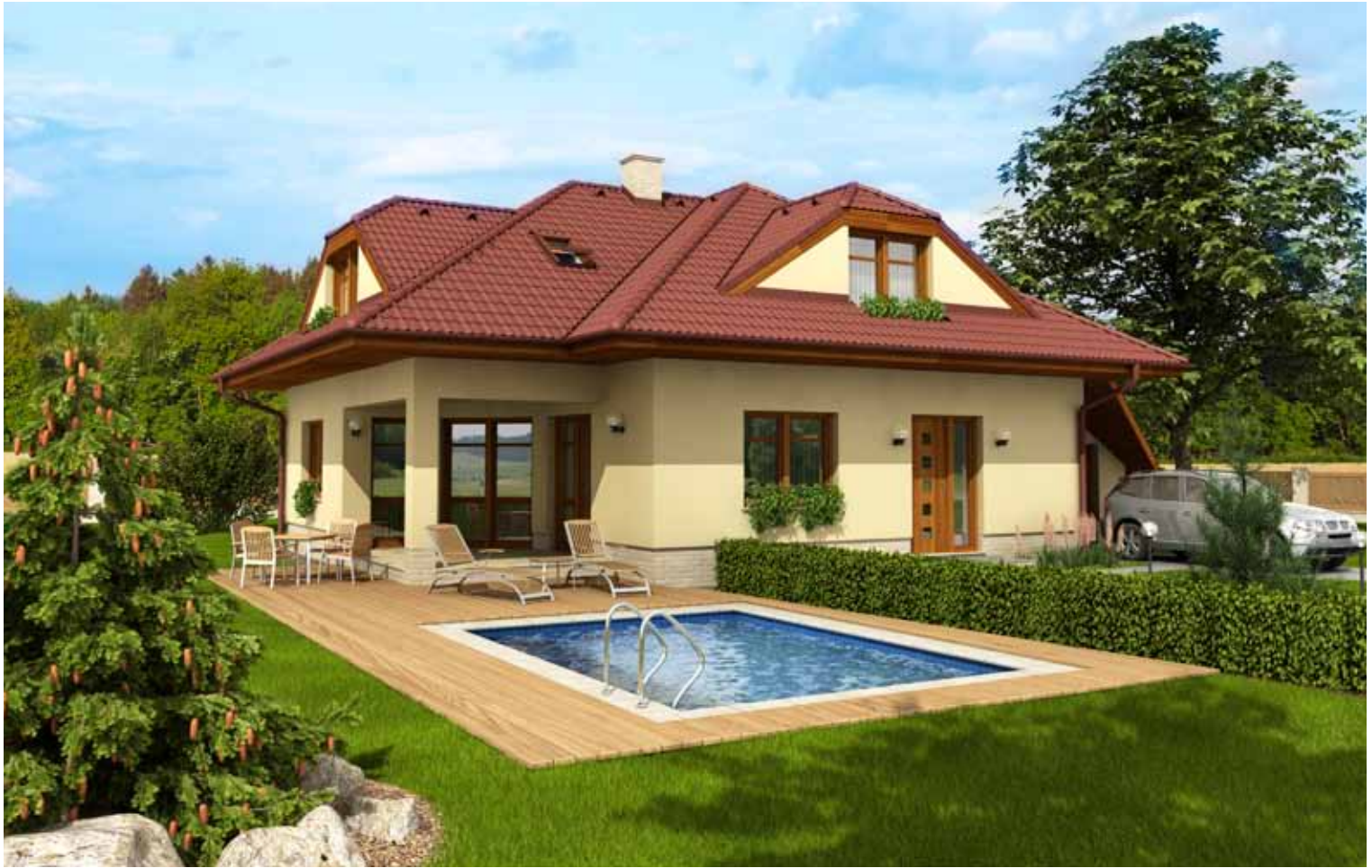
Typový rodinný dům ARGUS