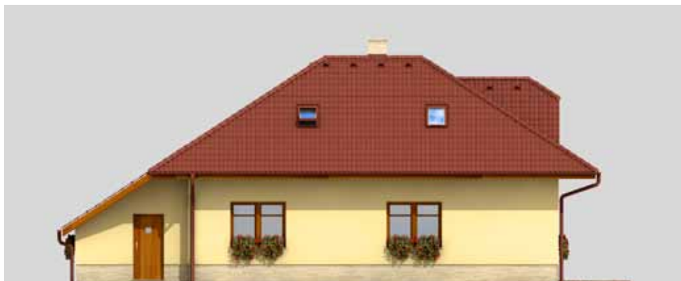
RD ARGUS – technické pohledy