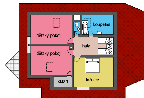
Půdorys rodinného domu ARGUS

konstrukce je v tomto případě dán tloušťkou 15cm izolace. Nyní se u všech typových domů firmy Hoffmann, s výjimkou domů pasivních, ve standardu používá izolace ze samozhášivého, stabilizovaného šedého polystyrenu s přísadou grafitu EPS plus a s hodnotou tepelného odporu R=5,40 \text{ m}^2\text{K/W} . Velkou výhodou systému VELOX je tepelná akumulace nosného betonového jádra obvodových a vnitřních nosných stěn. Tato výhoda znamená nízký účet za vytápění a velmi příjemné vnitřní klima i v parních letních dnech bez nutnosti klimatizovat, což snižuje náklady za elektrickou energii. Také z hlediska