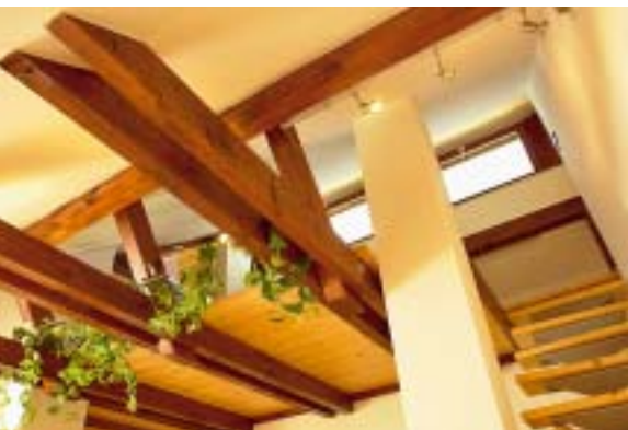
Velkorysý průhled z ložnice skrz galerii, pohledový krov a pultový vikýř až na oblohu