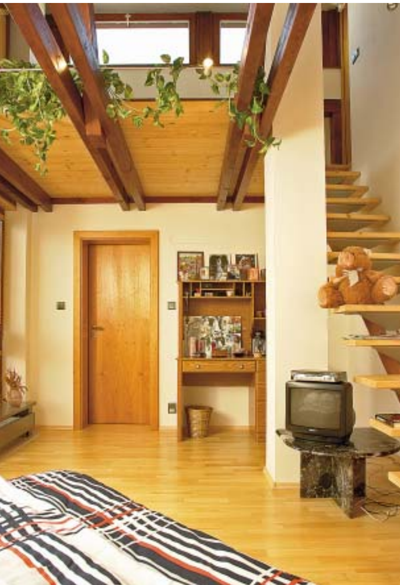
Pohledový krov s obnaženými kleštinami vytváří v případě ložnice nejen efektní prvek, ale také funkční galerii s pultovým vikýřem, jímž dohlédnete z lůžka až do nebe