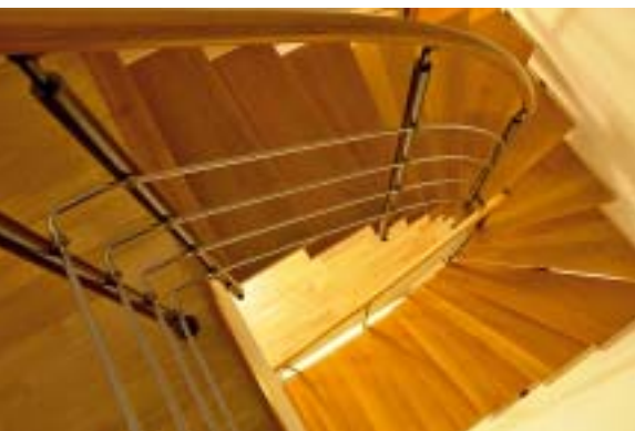
Elegantní křivky schodiště kombinují dřevo s nerezovou ocelí, sloupky jsou stříkány antracitovou barvou