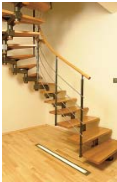
Zavěšené páteřové schodiště od firmy SMIP působí odlehčeným dojmem a zdola je efektně osvětleno podlahovou zářivkou