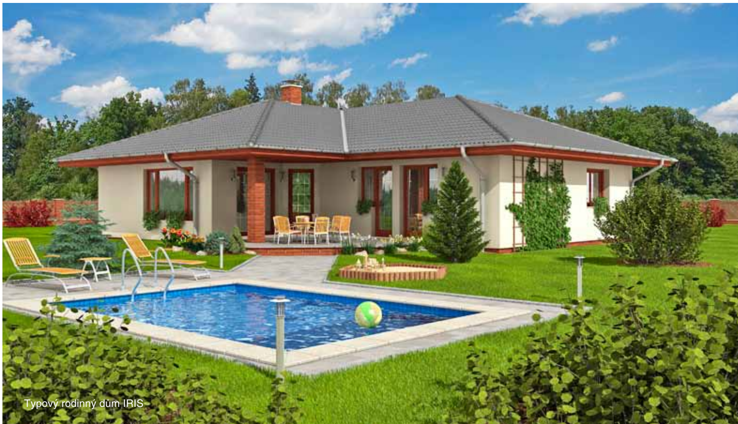
Typový rodinný dům IRIS