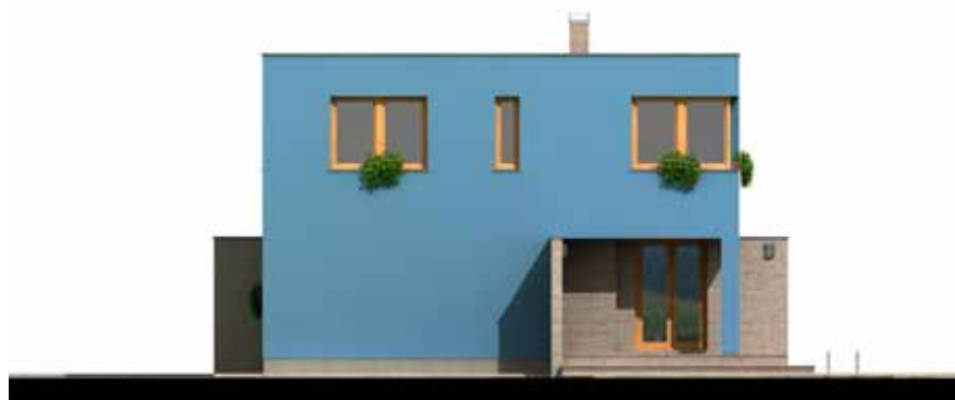
RD BLUES – technické pohledy