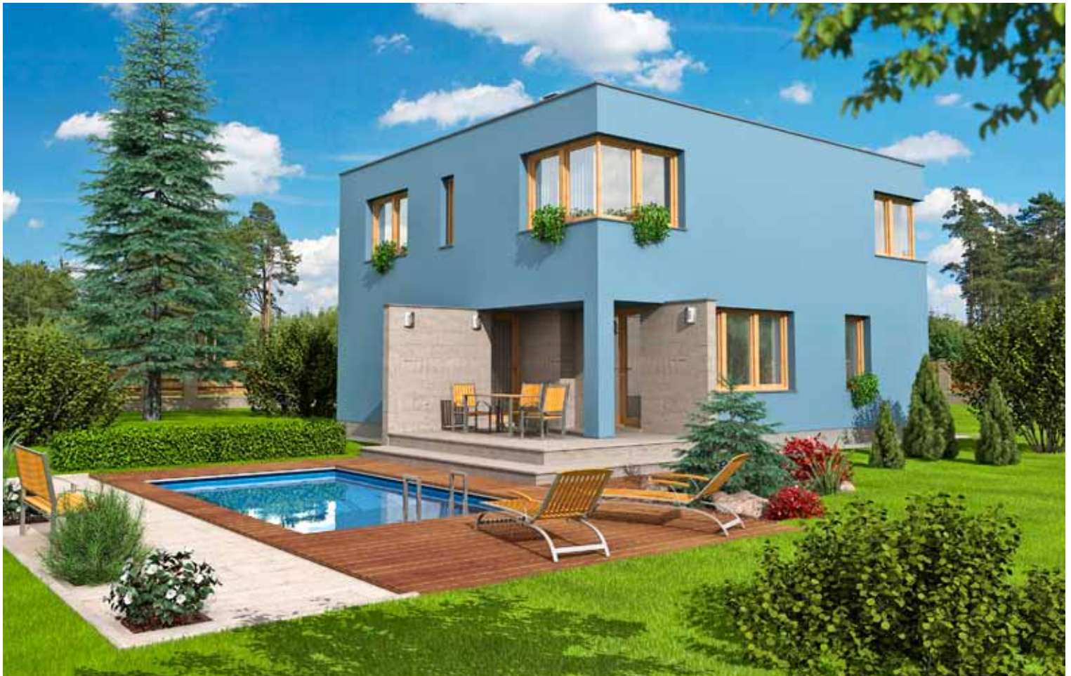
Typový rodinný dům BLUES