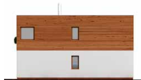
↑ RD OSIRIS – technické pohledy