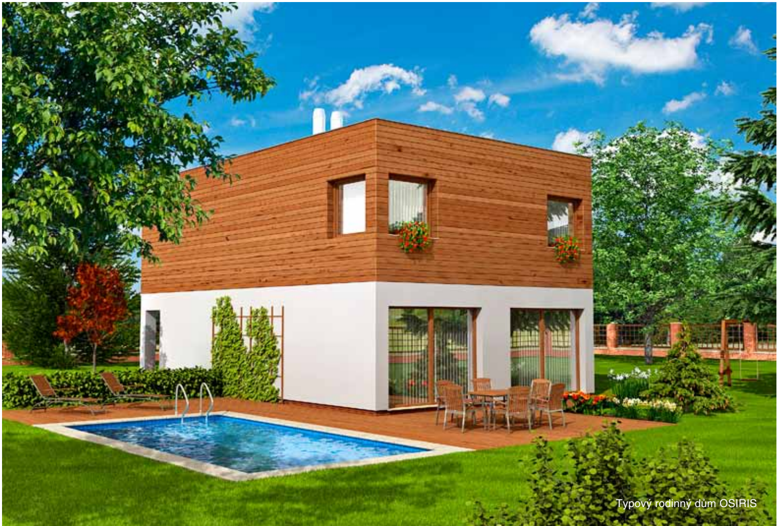
Typový rodinný dům OSIRIS